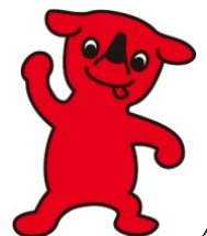
千葉県マスコット キャラクター 「チーバくん」

定員 100名(参加費無料) ◇第一部では参加した方にエコグッズのプレゼント、第二部ではクイズ大会(お子様向け)で勝ち残った方にプレゼントがあります。