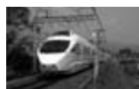
“風力電車” 小田急ロマンスカー-VSE