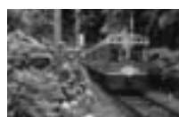
箱根登山鉄道あじさい電車の ライトアップはグリーン電力で