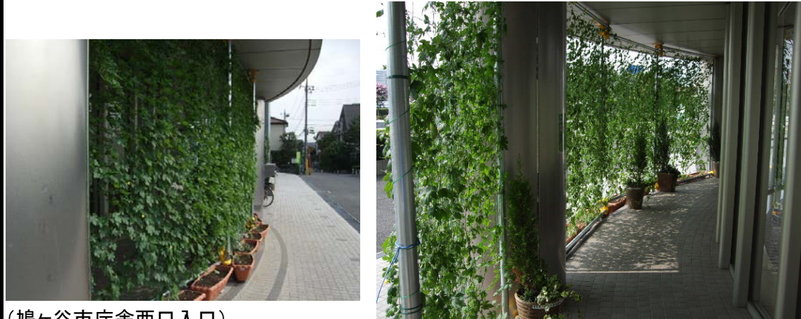
(鳩ヶ谷市庁舎西口入口)

来庁者に温度差を体感してもらえるコーナーとして緑のカーテントネルを設置 収穫したゴーヤは、市の保育所の給食に提供