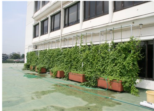
(鴻巣市本庁舎3F東側)